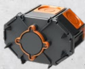
Membrandose M2 Tiefe 68mm