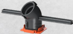
Wand- und Deckenkrümmer 30°