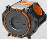
Membrandose M3 Tiefe 48mm