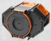
Membrandose M1 Tiefe 85mm